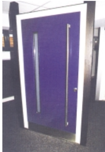
Fenster und Türen aus Holz und Kunststoff

Die Fertigung für Kunststoff-Fenster stellt ein bewährtes Standbein des gesamten Produktsortiments der Firma WALLBURGER dar.