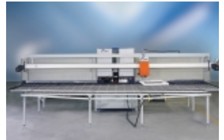
SE-4AS-CNC mit Wendestation SE-DO1/290

Mit Hilfe von Stürtz will WALLBURGER nach und nach den Bereich Fensterproduktion modernisieren.